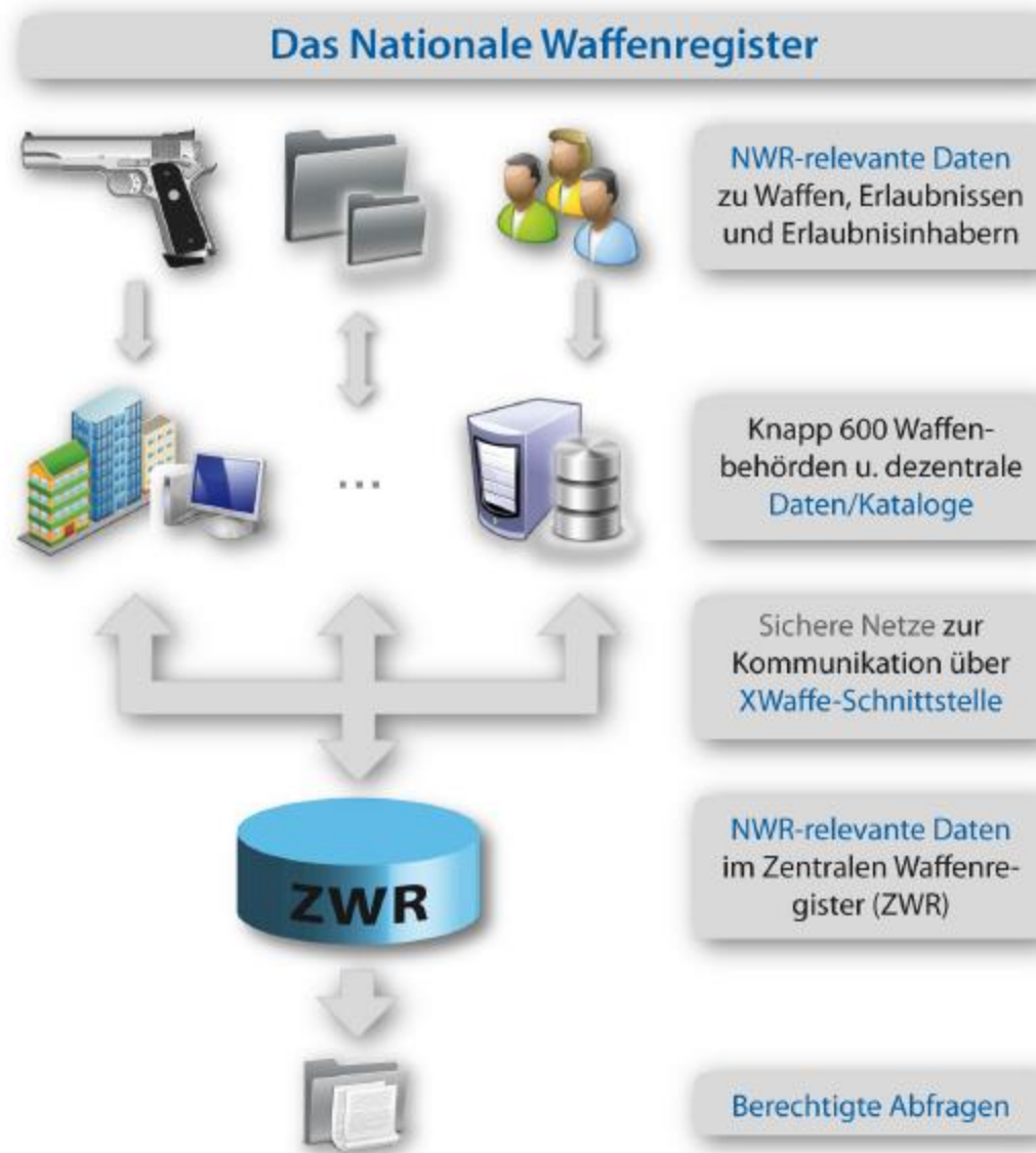
Abbildung 1. Das Nationale Waffenregister: Akteure und Prozesse